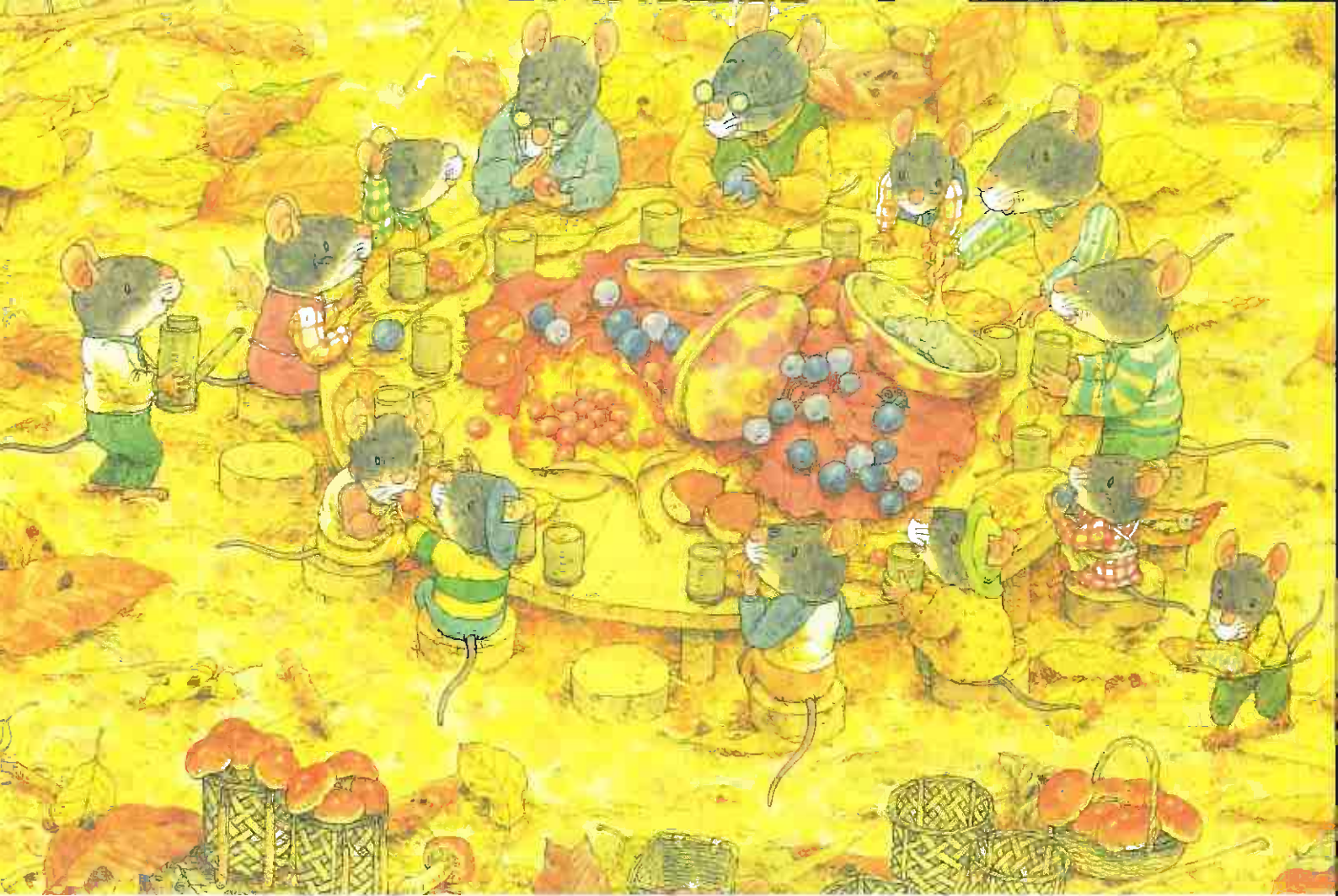
「14ひきのあきまつり」(童心社)、「かんがえるカエルくん」(福音館書店)